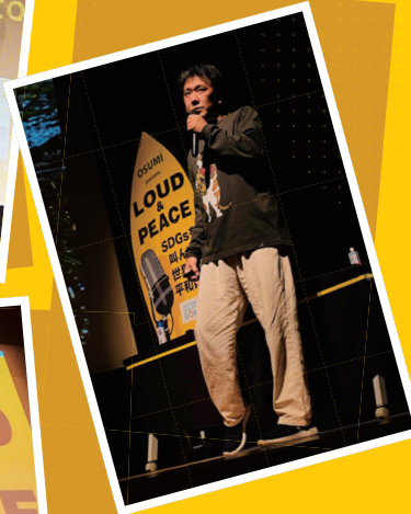
社員研修や学生の 学びの機会にも