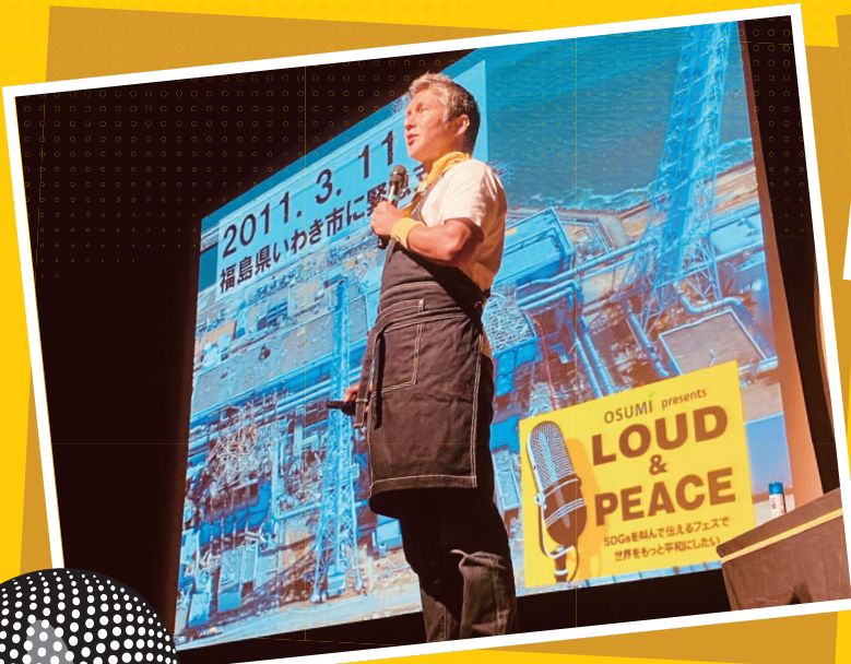
有識者や活動家が次々にプレゼン