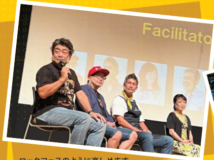
ロックフェスのように楽しめます